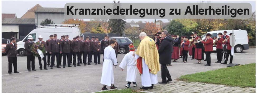
Kranzniederlegung zu Allerheiligen

Ruhet in Frieden! Gestorben ist nur, wer vergessen ist.